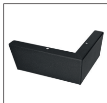
S 250 (H 6,5 cm) Metall, Schwarz pulverbeschichtet