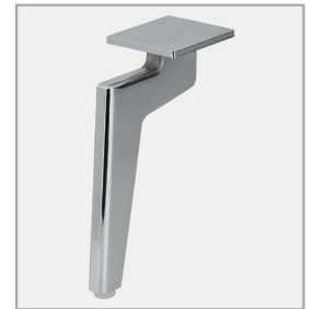
W010-M03 Metallfuß Hochglanz Chrom