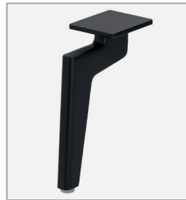
W010-M01 Metallfuß schwarz

Fußhöhe ca. 16 cm / Sitzhöhe 42 cm Fußhöhe ca. 18 cm / Sitzhöhe 44 cm