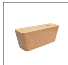
H 155 (H 6,5 cm) Buche: – natur Nr. 108 – wenge Nr. 119 – schwarz Nr. 250