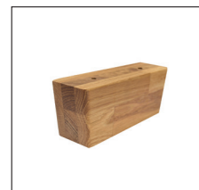
H 256 (H 6,5 cm) Eiche 400, geölt