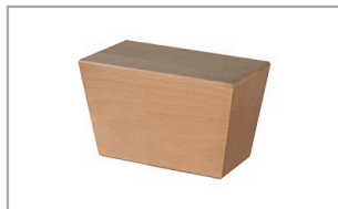
Holzfuß eckig Buche