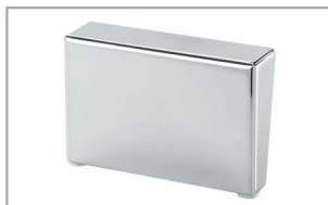
Metallfuß eckig Chrom glänzend