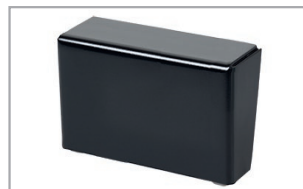
Metallfuß eckig schwarz pulverbeschichtet