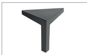
Metallfuß schwarz pulverbeschichtet