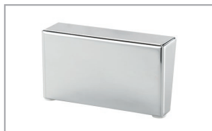
Metallfuß eckig Chrom glänzend