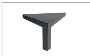
Metallfuß schwarz pulverbeschichtet