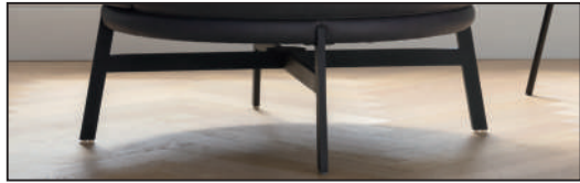
Metallfuß schwarz matt (282), 360° drehbar