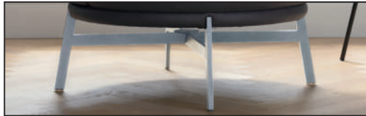
Metallfuß Chrom glänzend (281), 360° drehbar