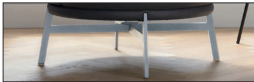
Metallfuß Chrom glänzend (281), 360° drehbar