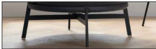
Metallfuß schwarz matt (282), 360° drehbar