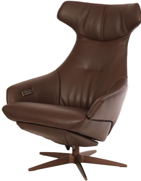
Abgebildet Modell- ARC