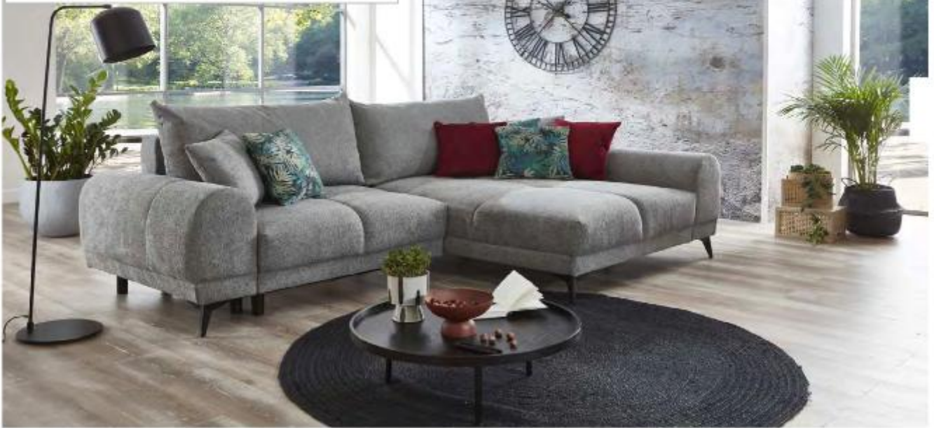
Bild: 2F BK (Li)-Rec (Re) Fuß Metall schwarz / Tula 12 mittelgrau (zusätzliche Zierkissen: Forest 3 grün + Monolith 69 burgund - nicht im Lieferumfang)

Schlaffunktion mit Bettkasten incl. 2 Rückenkissen + 2 Zierkissen in Polsterfarbe