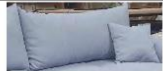
Detail 4: inklusive 2 Rückenkissen + 2 Zierkissen

Gestell: Tragende Teile aus massivem Hartholz, Verbindungen der tragenden Teile verdübelt oder verzapft, Spanplatte, Sperrholz