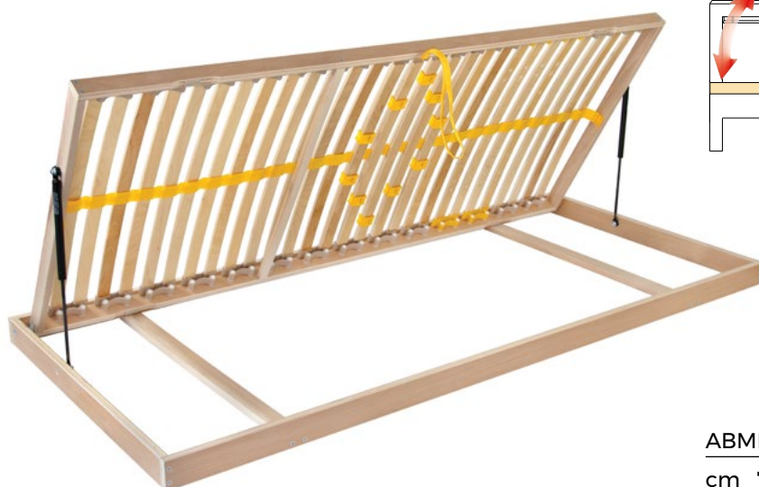
View from the foot of the bed Blick vom Fuß des Bettes