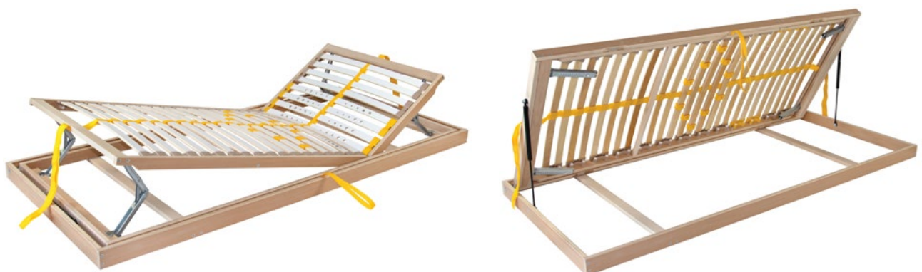
View from the foot of the bed Blick vom Fuß des Bettes