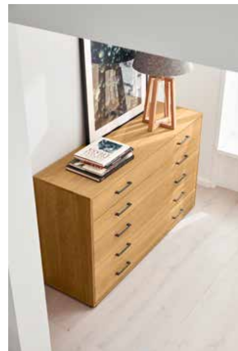
Chest 208 with 5 drawers, approx. W 141, H 86, D 43 cm