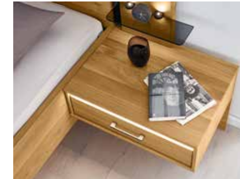
Schicke Alternative: Komfortbett 317 mit Stollenfußteil Chic alternative: comfort bed 317 with traditional foot section