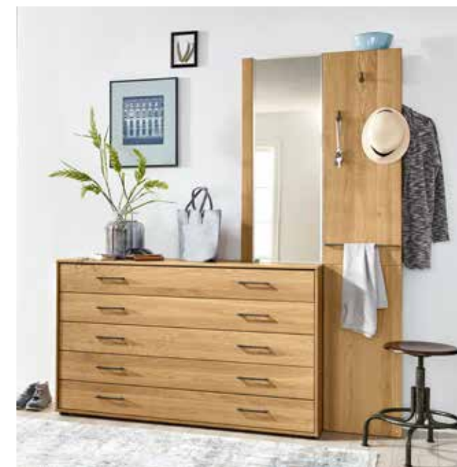
Kommode 208 in Kombination mit Anbau-Garderobenelement 255: mit Parsol-Bronze-Spiegel, Kleiderhaken und Kleiderstange, ca. B 179, H 194, T 23 cm