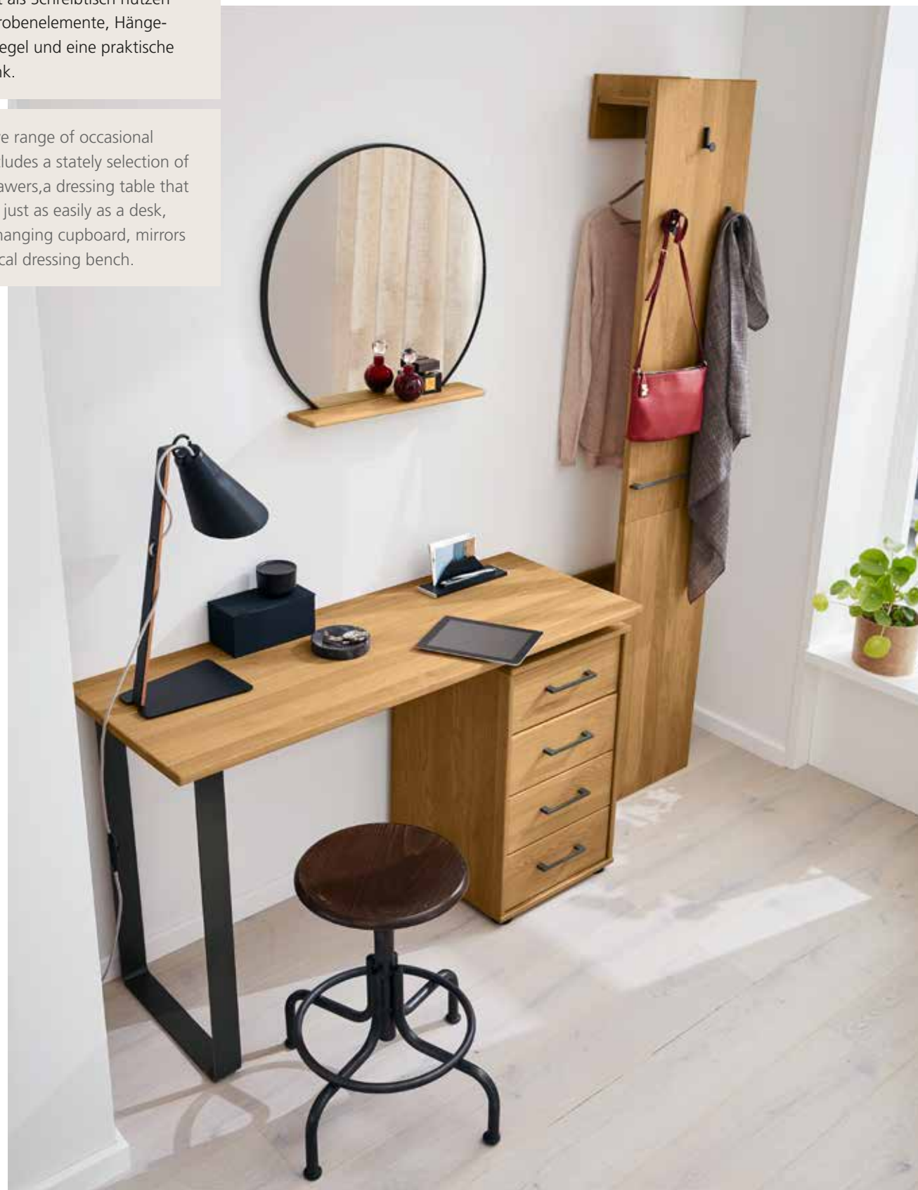
Frisier-/Schreibtisch 040 , ca. B 125, H 75, T 47 cm; Hängespiegel 088 , rund, mit Ablage, ca. 62 x 56 cm; Garderobenelement 251 , ca. B 38, H 194, T 23 cm; Dressing table / desk 040 , approx. W 125, H 75, D 47 cm; wall mirror 088 , round, with shelf, approx. 62 x 56 cm; coat rack 251 , approx. W 38, H 194, D 23 cm

The extensive range of occasional furniture includes a stately selection of chests of drawers, a dressing table that can be used just as easily as a desk, coat racks, hanging cupboard, mirrors and a practical dressing bench.