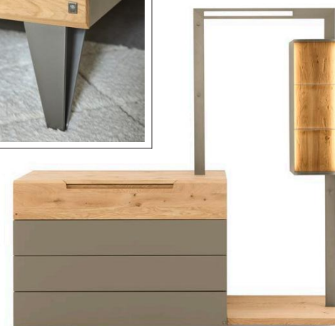
Kommode mit Anstell-Garderobe