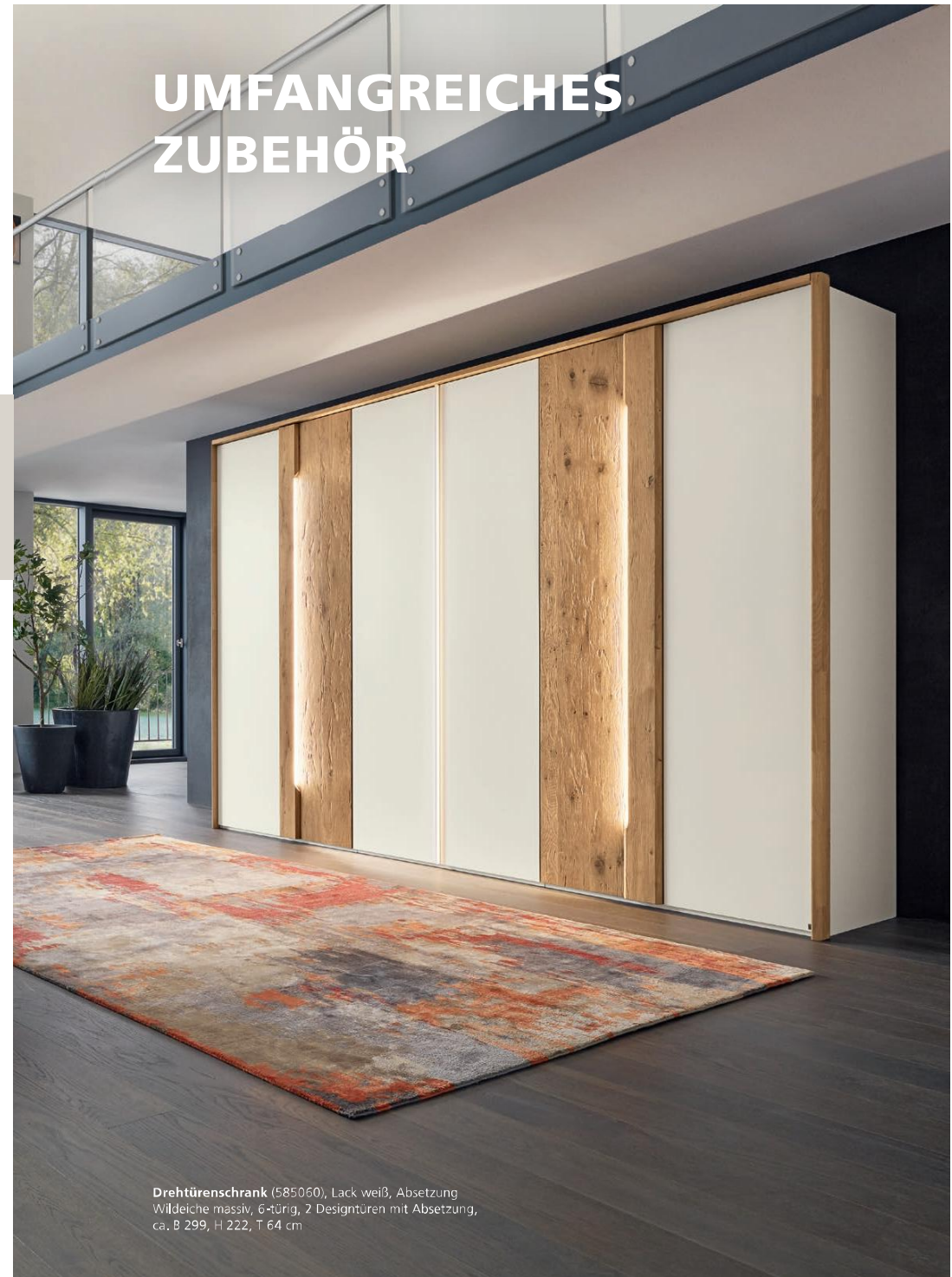
Drehtüreschrank (585060), Lack weiß, Absetzung Wildeiche massiv, 6-türig, 2 Designtüren mit Absetzung, ca. B 299, H 222, T 64 cm