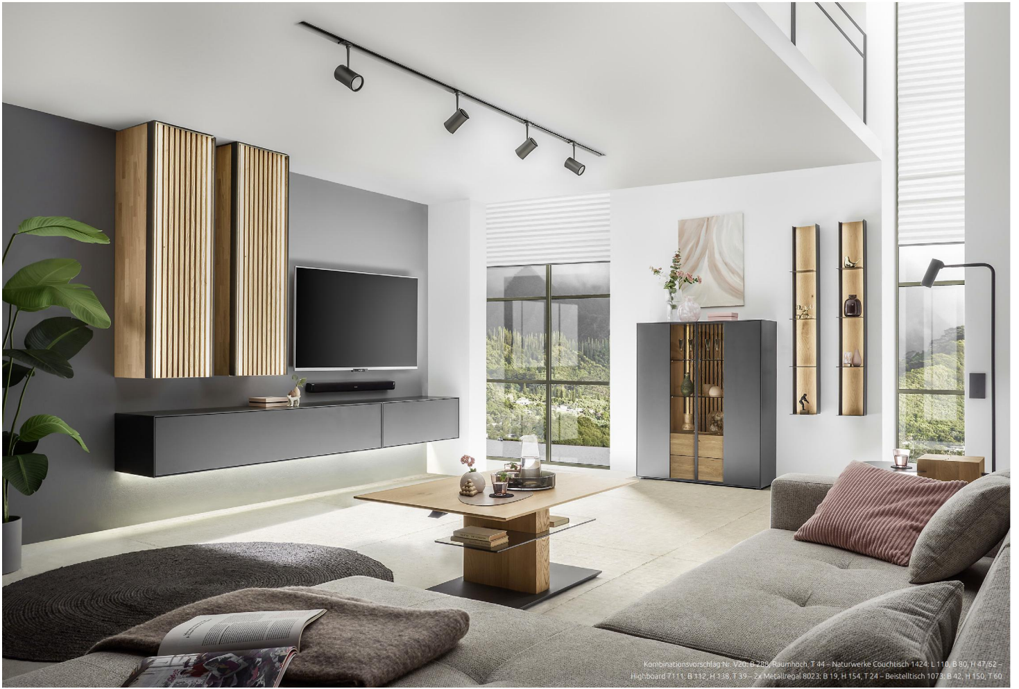
Kombinationsvorschlag Nr. V20: B 285 - Raumhoch, T 44 - Naturwerke Couchtisch 1424: L 110, B 90, H 47/62 - Highboard 7111: B 132, H 138, T 39 - 24 Metallregal 8023: B 19, H 154, T 24 - Beistelltisch 1073: B 42, H 150, T 60