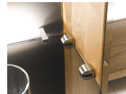
Glasbodenträger Bieten festen Halt auf allen Ebenen und avancieren dabei selbst zum Designelement.