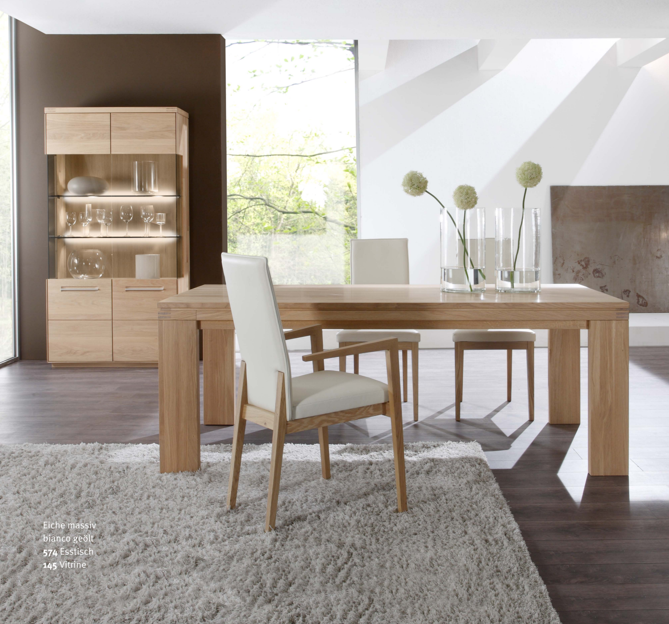
Eiche massiv bianco geölt 574 Esstisch 145 Vitrine