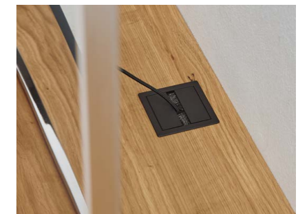
Kabelmanagement Verkabelung komplett gelöst mit Kabeldurchlass. Passend zur Griffausführung.