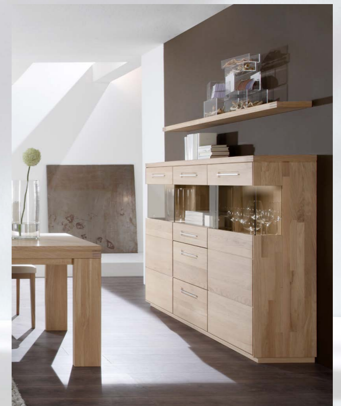
Highboard 110 in Eiche massiv, bianco geölt, Breite 182,0 cm, Variable Ausstattung durch Rückwände, Gläser, Akzente und Beleuchtung. Steckbord 725 in der Breite 182,0 cm.

Wohnen und Speisen in Harmonie. Ein fließender Übergang. Venta plus in Bianco geölt unterstreicht die Leichtigkeit Ihrer Räume.