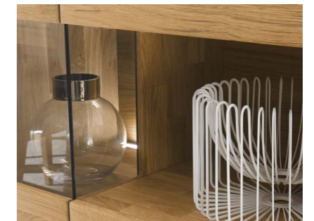
Nische Ein ganz besonderes Designmerkmal: nach innen versetztes Glas.