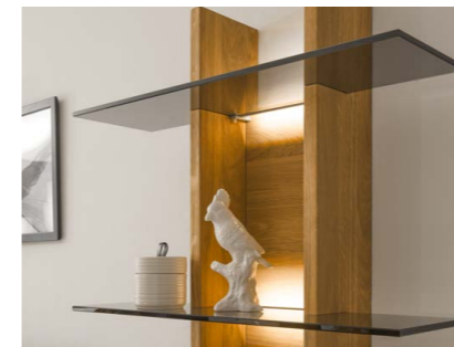
Glasböden Parsolglas in grau harmoniert mit Wildeiche und LED-Beleuchtung.

Charakterstark und einzigartig. Mit Elementen, die Sie nach Ihren Wünschen anpassen. Rückwände, Türen und Böden in hochwertigsten Ausführungen plus clevere technische Details machen jedes Möbel zu einem Unikat.