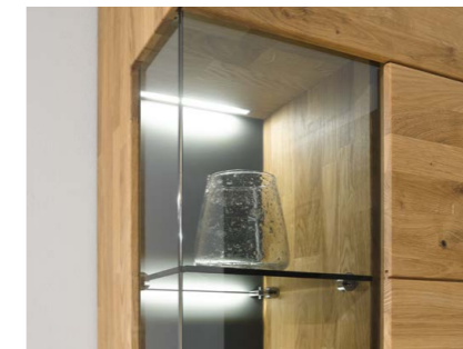
Front- und Seitenverglasung Das umlaufende Glas macht die Tiefe des Möbels und den Raum der Vitrine sichtbar.