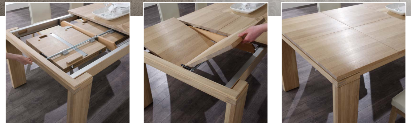
Esstisch Dieser Tisch passt sich an. Bei Bedarf mit Verlängerung von 2 x 50 cm oder 1 x 1 m. Mit im Tischbein integrierten Rollen, die ihn leicht bewegen, gleichzeitig aber auch zu jeder Zeit Halt bieten. Massive Bauweise, leicht und designorientiert.

Bitte nehmen Sie Platz. Es erwartet Sie ein Speisezimmer der Extraklasse. Elegant. Stilvoll. Gradlinig und großzügig. Mit viel Stauraum, praktischen Lösungen und hohem Designanspruch. Eine klare Formensprache und Elemente mit dezenter Hintergrundbeleuchtung strahlen Ruhe und Gelassenheit aus. Ob das gemeinsame Essen mit der Familie oder eine große Runde mit Freunden – Venta plus passt sich Ihren Anforderungen an.