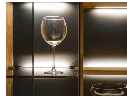
Parsolglas grau Setzt die Dekoration in Szene. Warmes LED-Licht im Hintergrund und blendfreie Flächen.