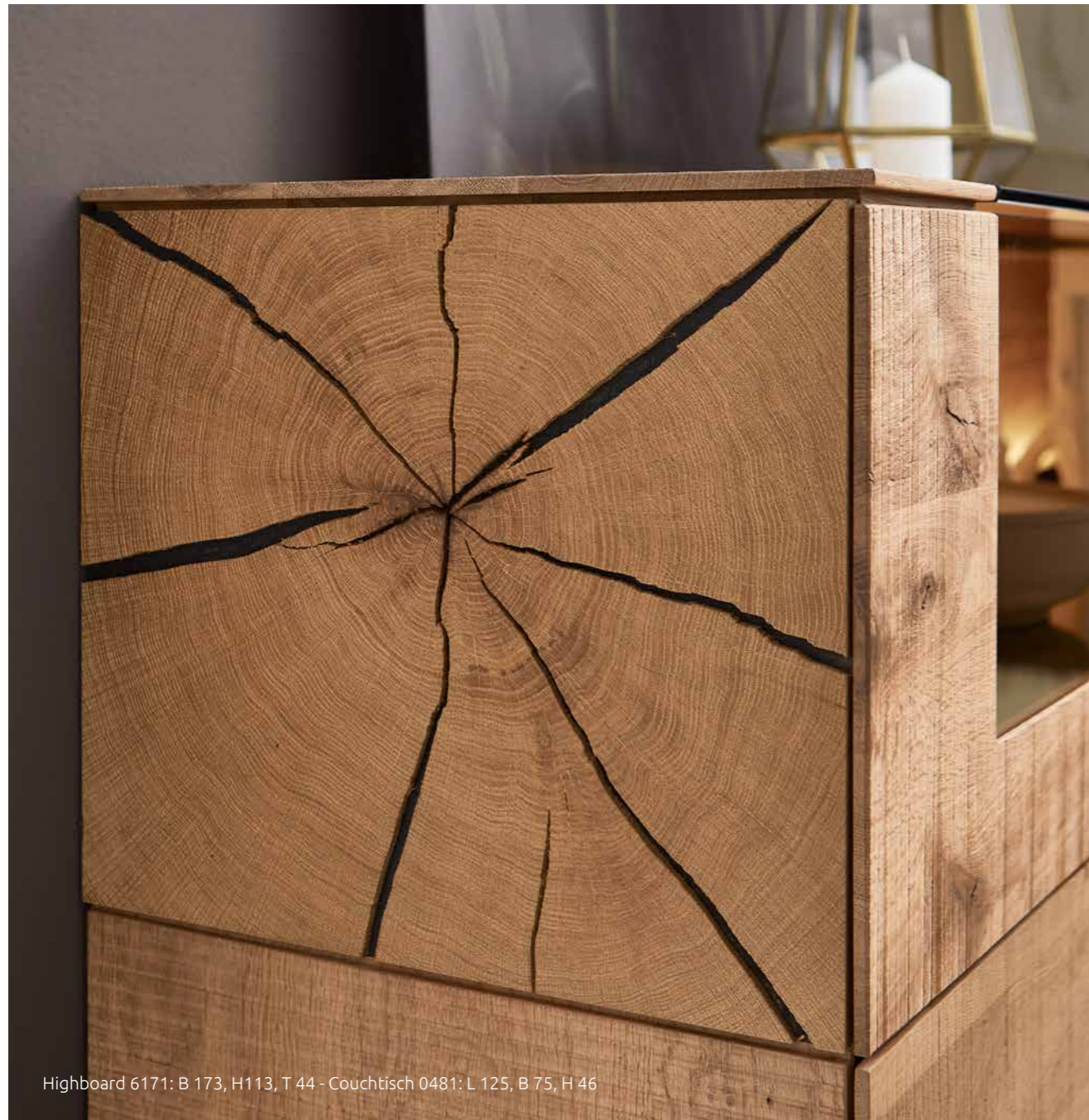
Highboard 6171: B 173, H113, T 44 - Couchtisch 0481: L 125, B 75, H 46