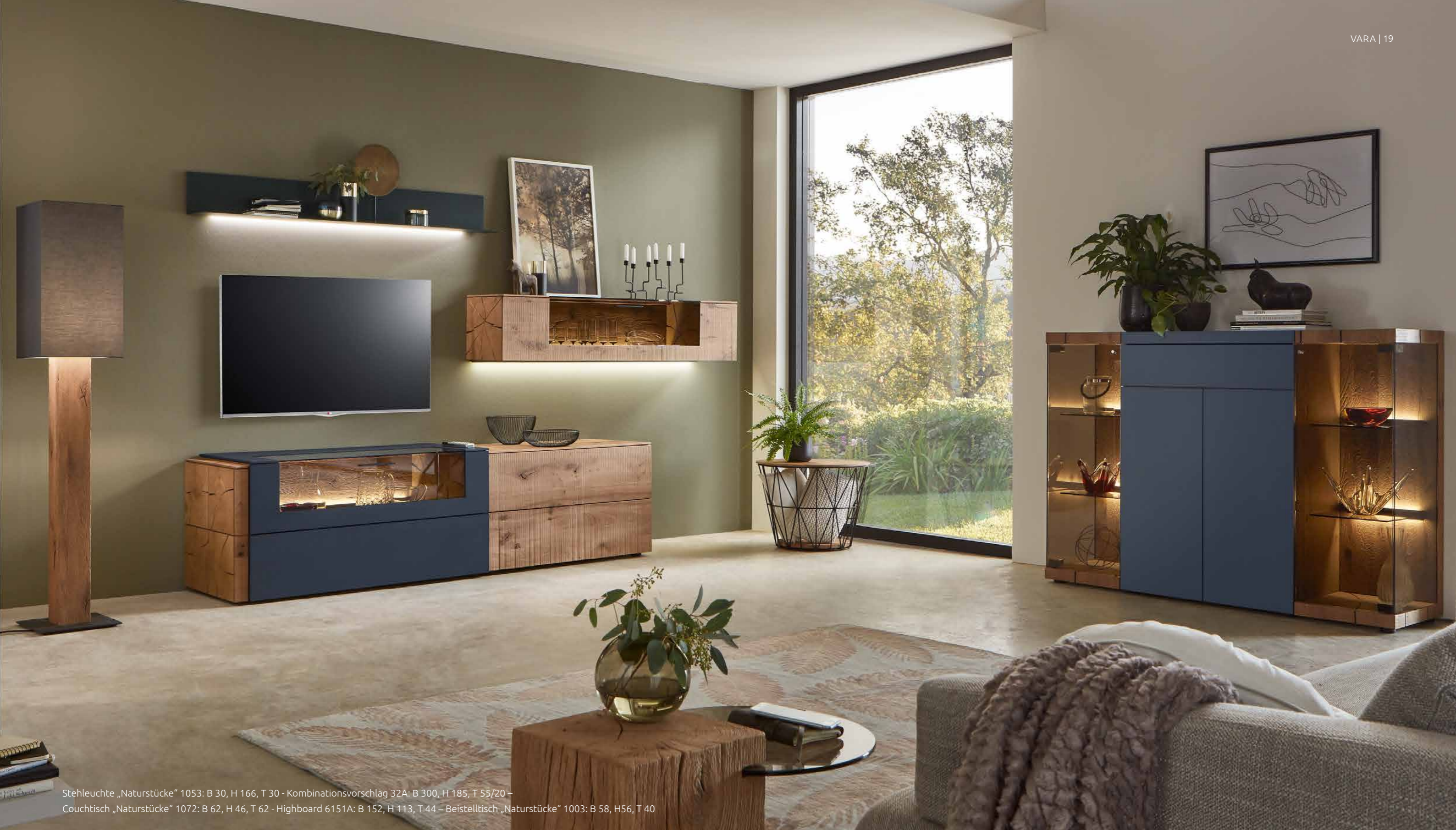
Stehleuchte „Naturstücke“ 1053: B 30, H 166, T 30 - Kombinationsvorschlag 32A: B 300, H 185, T 55/20 - Couchtisch „Naturstücke“ 1072: B 62, H 46, T 62 - Highboard 6151A: B 152, H 113, T 44 - Beistelltisch „Naturstücke“ 1003: B 58, H 56, T 40