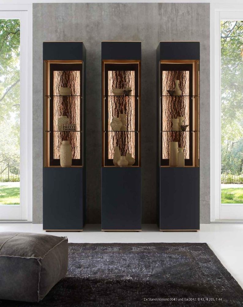
2x Ständeelement 0041 und 1x 0042: B 43, H 205, T 44