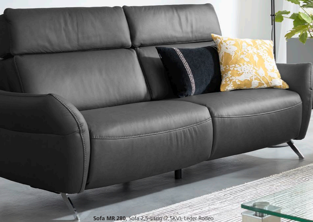
Sofa MR 280 , Sofa 2,5-sitzig (2,5KV), Leder Rodeo charcoal (PG 60); Metallfuß chromfarbig (W004-M03), ca. B 188, H 98-114, SH 46, ST 56, T 103 cm; Sofa 3-sitzig (3KV), Leder Rodeo charcoal (PG 60), Metallfuß chromfarbig (W004-M03), ca. B 216, H 98-114, SH 46, ST 56, T 103 cm. Beimöbel : Fabia Multiplo