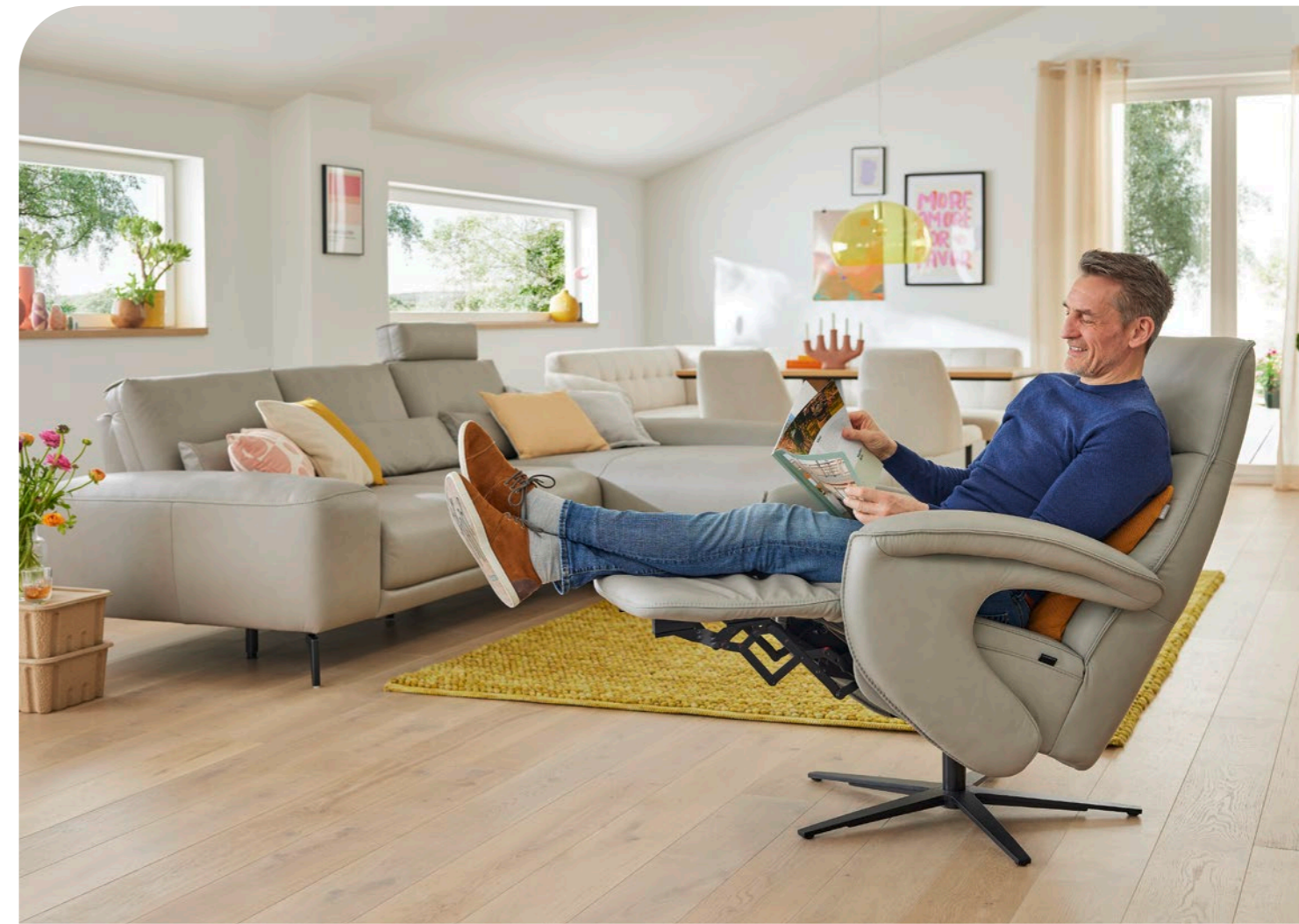
Ecksofa MR 290 , bestehend aus Sofa 2,5-sitzig, Armlehne links (2,5L), Canapé, Armlehne rechts (CanGX R), Sitzkomfort Softlook, Rücken echt, Leder (PG 58, z.B. Vivre alu), Metallfuß schwarz, matt (W010-M01), ca. 307 x 199, H 86, SH 46, T 113 cm